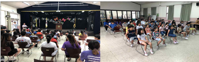
7월 25일(목)에는 여름방학식을 하였습니다. 1학기 동안 이루어진 교육활동을 돌아보았고, 여름방학에 지켜야 할 안전생활에 대해 이야기 하였습니다.