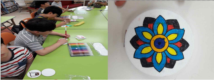
7월 22일(월)에는 책을 읽고 마음의 거울에 표현해보는 독후 활동을 하였습니다.